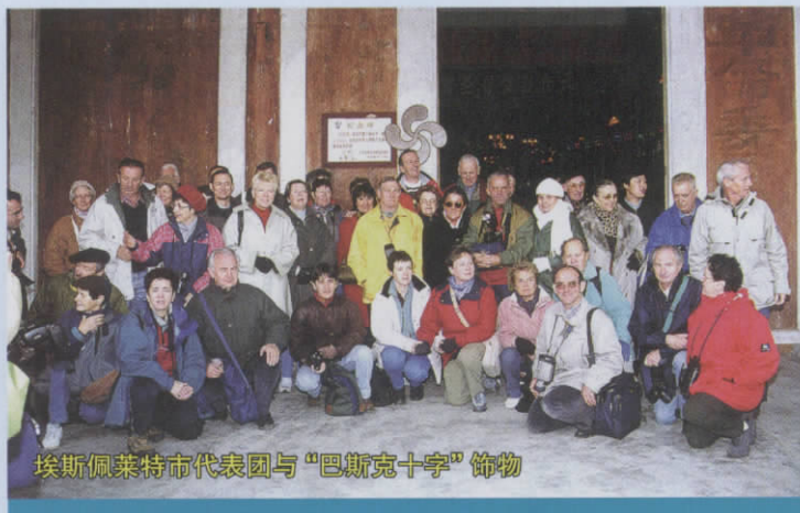
埃斯佩莱特市代表团与“巴斯克十字”饰物