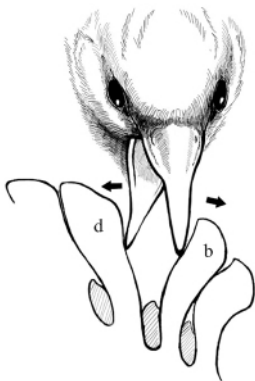
图 2 红交嘴雀取食松果示意图 (仿 Benkman [6] )

对莲花山的云杉、麦吊云杉( P. brachytyla )、紫果云杉、华北落叶松和华山松的松果特征取样分析,结果见表 3。单因素方差分析表明,各种球果在针对红交嘴雀取食防御的相关特征(如球果种鳞厚度等)及球果重量、含有的种子数等方面都具有显著差异。较大的球果拥有更厚的种鳞,防御种子被取食的能力也更强。